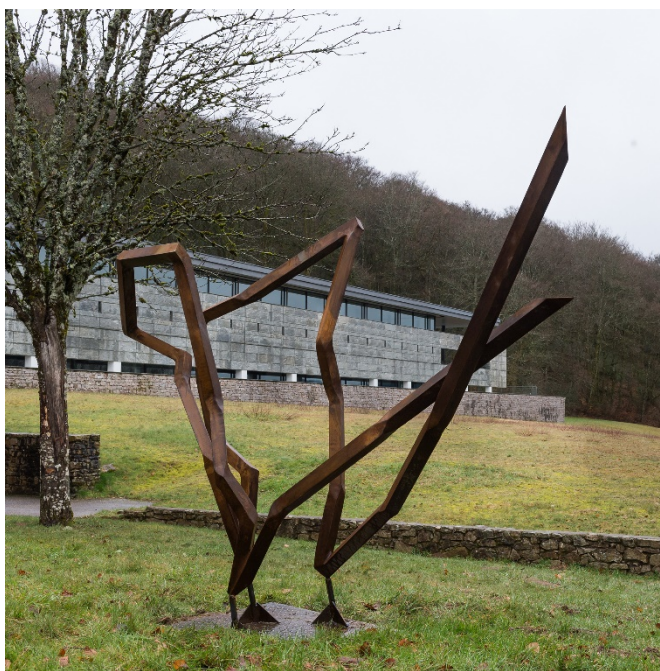
Sculpture SIGALLE, face au musée de Bibracte..