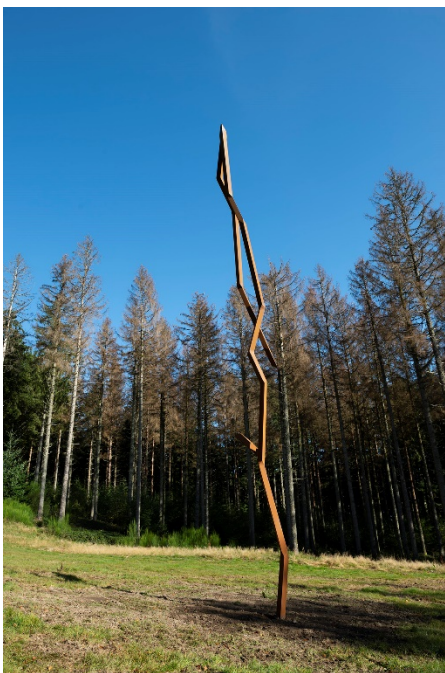
Sculpture GEOT, installée sur le mont Beuvray

Les œuvres jouent avec l'architecture et le paysage. L'espace d'une saison, elles se posent délicatement dans l'exposition permanente du musée de Bibracte, tant les sculptures de Robert Schad expriment la légèreté et le mouvement, faisant littéralement danser ce matériau pesant et rigide, mais en même temps très malléable, qu'est l'acier.