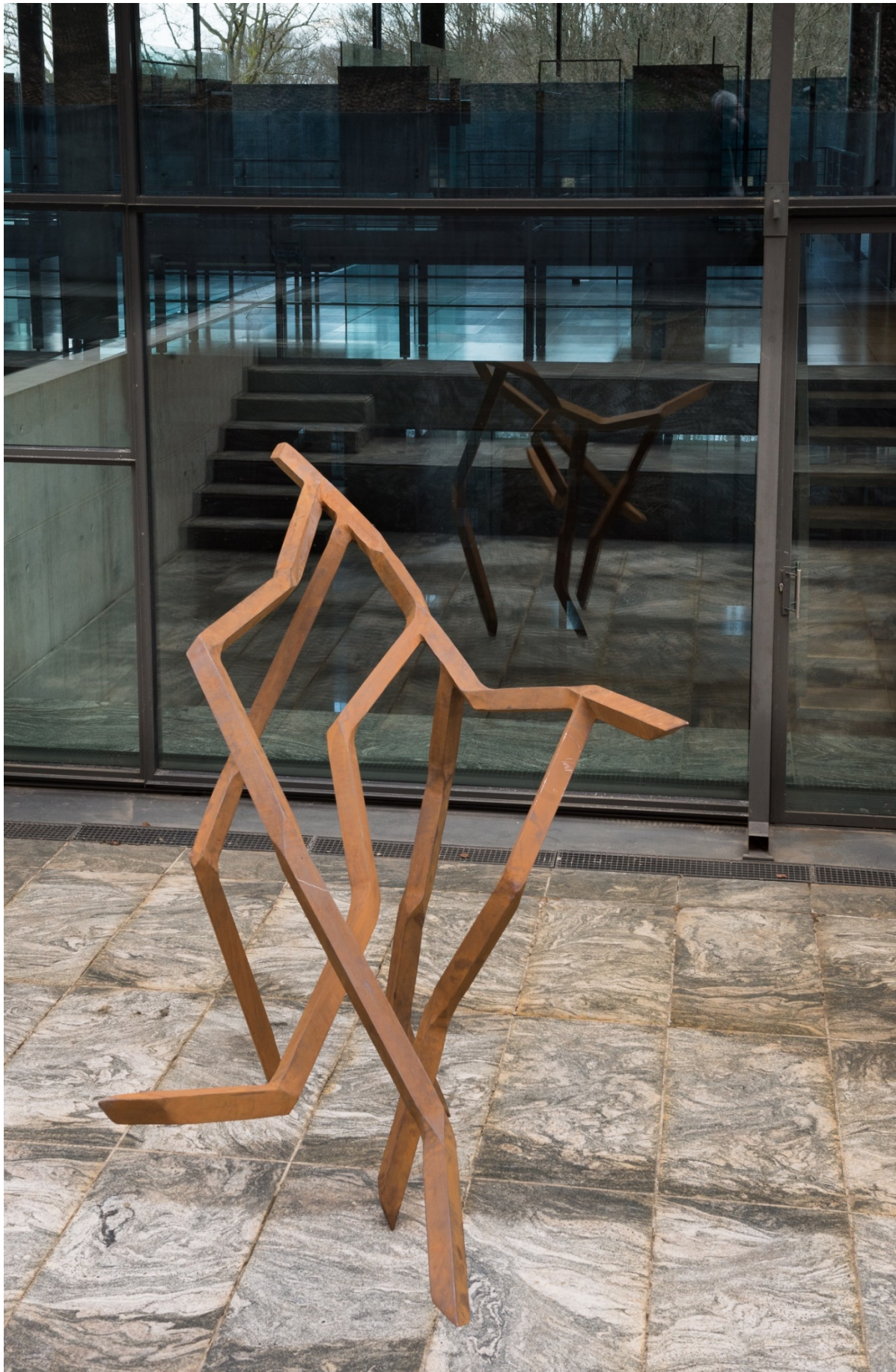
Une des sculptures de Robert Schäd, installée dans une alvéole extérieure du musée.