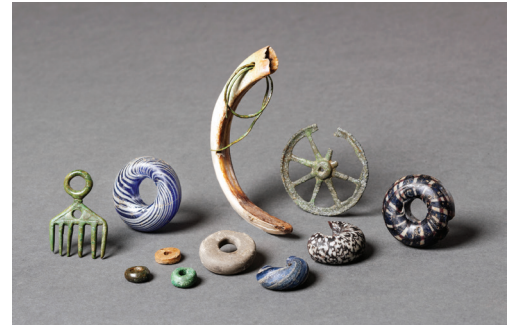
Parures de la fin de l'âge du Fer découvertes dans les fosses du Mormont : pendentifs, perles en verre, en pierre et en bronze, canine de porc montée en pendentif

D'un simple enfouissement de déchets à une pratique rituelle codifiée, comment percevoir l'intention qui se cache derrière chaque dépôt à partir des seuls vestiges archéologiques ?