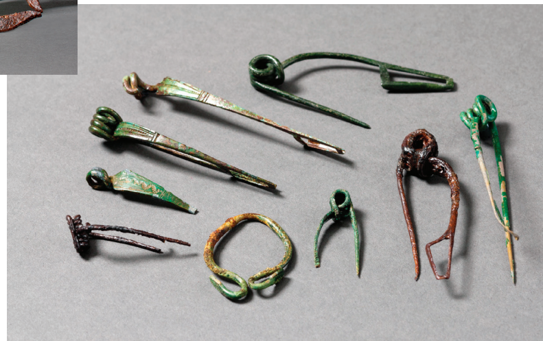
Sélection de fibules découvertes sur le Mormont, bronze et fer, fin du second âge du Fer © Musée cantonal d'archéologie et d'histoire, Lausanne.

Vaisselle de prestige, céramique, meules, outillage métallique, entraves, bijoux, monnaies, ce sont plus de 200 objets qui sont présentés dans l'exposition, pour la première fois en France.