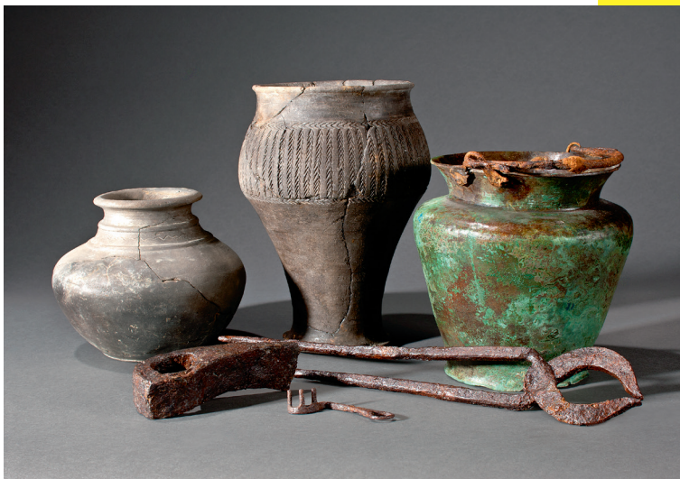
Récipients en céramique, situle en bronze et fer, lame de hache, clé et pince en fer

Vaisselle de prestige, céramique, meules, outillage métallique, entraves, bijoux, monnaies, ce sont plus de 200 objets qui sont présentés dans l'exposition, pour la première fois en France.