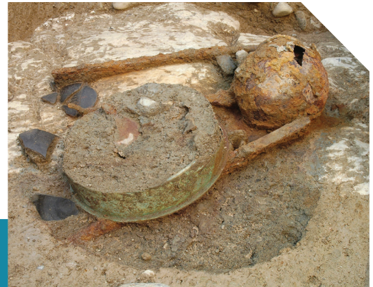
Dépôt au fond de la fosse 291 constitué d'un tonnelet en céramique, un bassin en bronze, une situle contenant six lames de haches en fer, trois barres de fer et un poêlon en fer.

Isolés ou en amas, entiers ou sous forme de fragments, le comblement des fosses du Mormont a livré un très grand nombre d'objets, souvent très bien conservés.