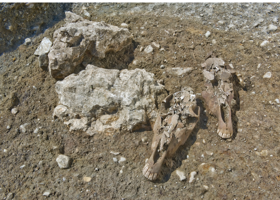
Fosse 554 : dans la partie médiane de la fosse ont été déposés deux crânes appartenant à une jument et à un étalon

Ces objets appartiennent à toutes les catégories en usage à la fin de l'âge du Fer, à l'exception notable des armes. S'y trouvent ainsi, des ustensiles culinaires, de la vaisselle métallique prestigieuse aux côtés d'objets de la vie quotidienne, des outils d'artisans comme des restes d'activités métallurgiques, mais aussi de la parure, des monnaies ou encore des jetons, associés à des ossements d'animaux, et à de nombreux ossements humains.