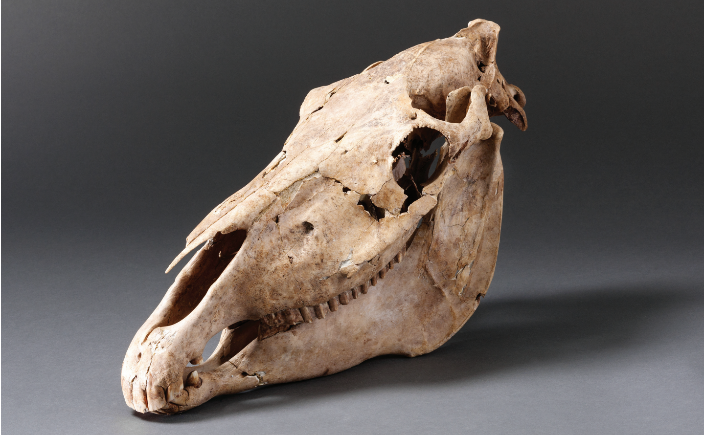
Crâne de cheval d'origine méditerranéenne, fosse n°45

P armi les milliers d'ossements extraits des fosses du Mormont, on trouve toute la diversité du cheptel domestique du second âge du Fer : bœufs, moutons, chèvres, porcs, mais aussi chevaux et chiens. L'âne et les animaux sauvages, comme l'ours, le cerf ou le loup, sont nettement plus inhabituels.