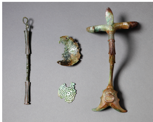
Fragments d'ustensiles en bronze liés à la consommation du vin, découverts sur le Mormont : manche de simpulum (louche), passoirs et anse d'enochoé. © Musée cantonal d'archéologie et d'histoire, Lausanne. Photo Y. André.