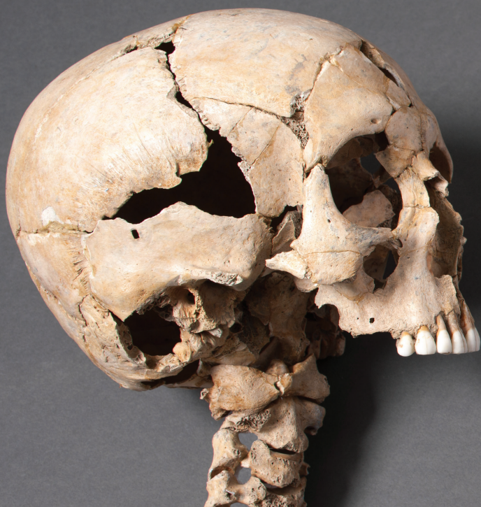
Tête coupée d'une jeune femme (visuel présenté dans l'exposition) Elle est révélatrice de la singularité des manipulations des restes humains observées au Mormont. Si le crâne est encore solidaire des cinq premières vertèbres cervicales, la mâchoire inférieure, en revanche, a été volontairement détachée du crâne. La tête a été déposée à côté du crâne d'un homme et d'une dizaine de reste d'animaux.

Que conclure face à cette diversité des pratiques et du traitement des corps humains, si difficile à interpréter ? Ce qui interpelle au Mormont, c'est la proximité inhabituelle entre le traitement des restes humains et celui des restes animaux.