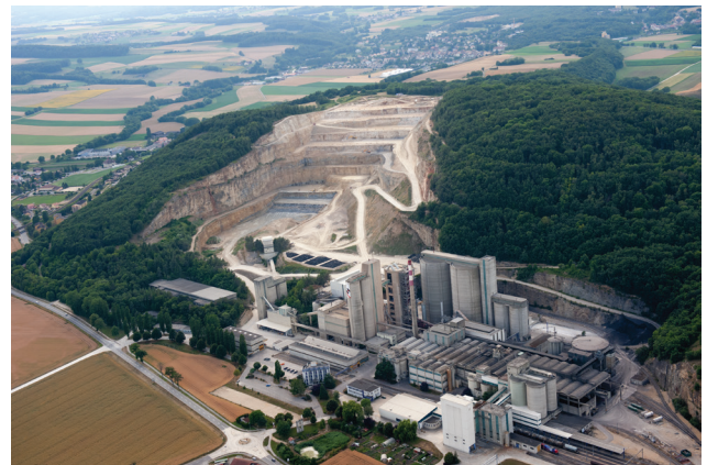
La colline du Mormont, sa carrière de calcaire et sa cimenterie, été 2010. En bordure de la carrière en cours d'exploitation, la fouille archéologique.

Le site du Mormont a fait l'objet de recherches archéologiques entre janvier 2006 et septembre 2016. Durant cette décennie, la durée totale des fouilles a été de 53 mois, avec une équipe composée de 8 à 10 archéologues. Une opération d'une envergure exceptionnelle.