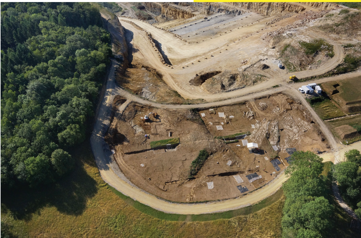
La fouille précède l'exploitation de la carrière. Ici, le secteur fouillé en 2015

Une telle variété n'a aucune comparaison sur les autres sites de l'âge du Fer en Europe: les vestiges du Mormont ne ressemblent ni à une nécropole, ni à un site d'habitat, ni même à un de ces sanctuaires architecturés que l'on connaît ailleurs dans le monde celtique. Face à cette singularité, c'est bien dans les centaines de fosses que se trouve la principale clé de compréhension du site.