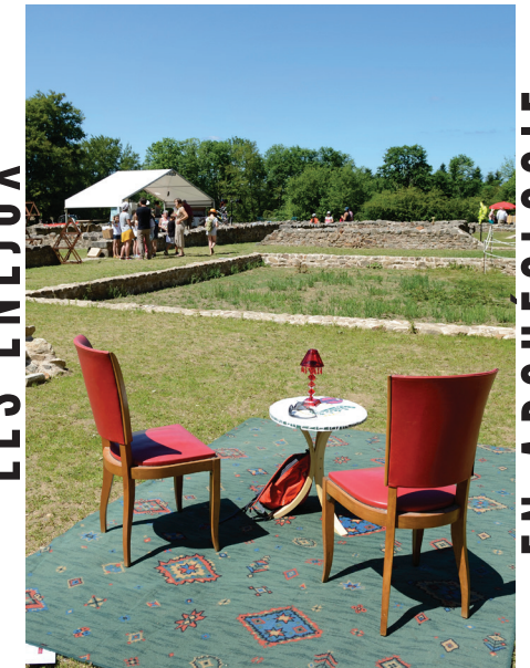
cliché Bibracte/A. Mallier, 2017